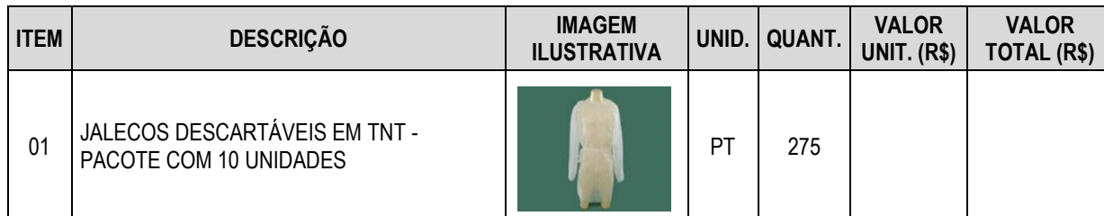
TABELA DESCRITIVA / QUANTITATIVA

OBS: Os preços da tabela acima devem ser apresentados em Reais (R$).