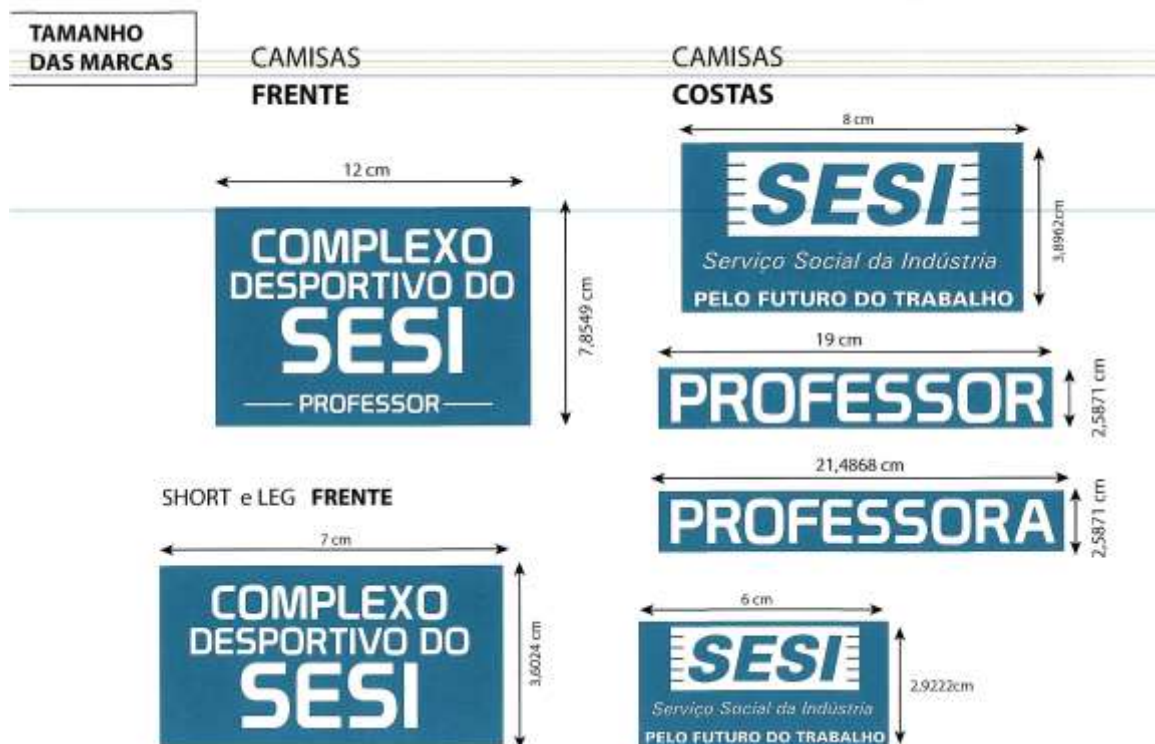
TABELA DE MEDIDAS PARA OS ITENS 08,09,10,11 E 12